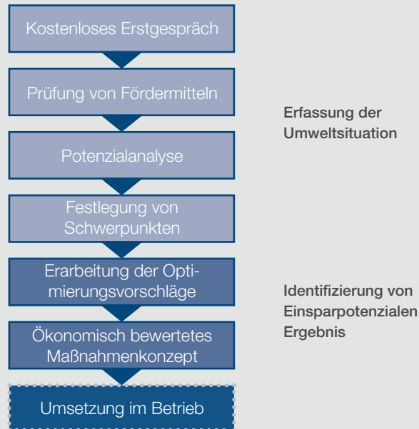
Ablauf der Potenzialberatung

Der Effekt: Sie sparen Kosten und schützen die Umwelt!